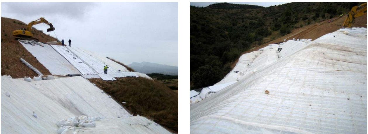
Figures 6 et 7. Mise en place de la géogridde de retenue des terres