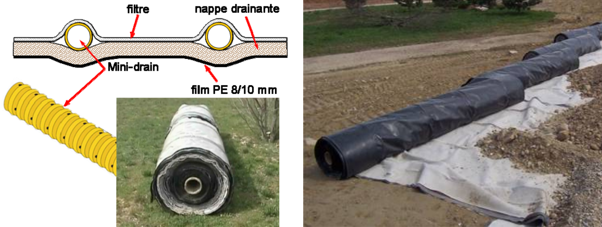
Figures 1 et 2. Description du géocomposite de drainage et d'imperméabilisation

Le géocomposite est présenté sur les figures 1 et 2. Les rouleaux ont une largeur de 4 m.