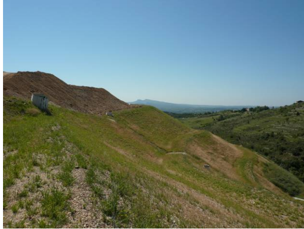
Figure 9. Couverture après végétalisation