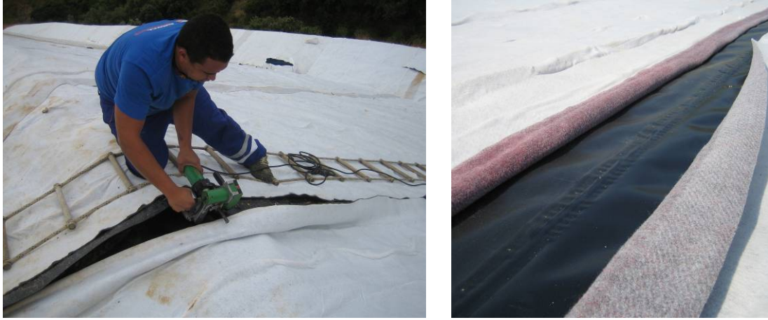
Figures 4 et 5. Soudure de la membrane en continu