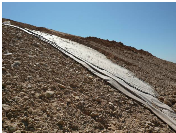
Figure 8. Mise en œuvre de la terre végétale

La couche de terre végétale est mise en œuvre sur la couverture géosynthétique sur une épaisseur de 0,3 m (figure 8).